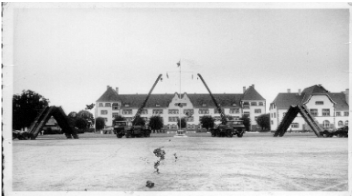
Photo de la cour d'honneur prise en 1965